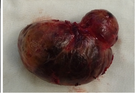
Resim 3. Kitlenin rezeksiyon sonrası görünümü.