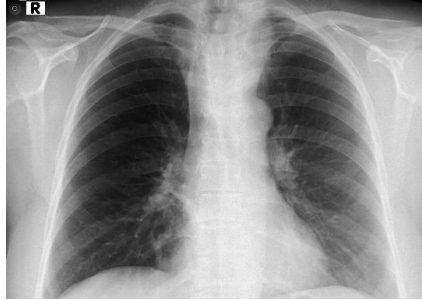
Resim 2. Olgunun geçmişe ait posteroanterior akciğer grafisinde mediastendeki dolgunluk ve trakeadaki sağa doğru itilme izlenmektedir.